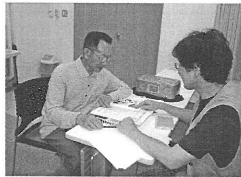
華友会日本語教室の指導風景