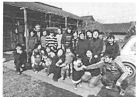
春節パーティー (2012. 3. 11)