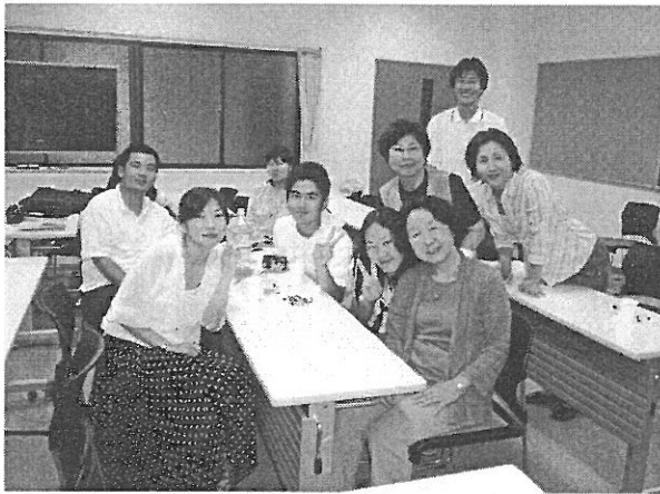
華友会日本語教室のメンバー