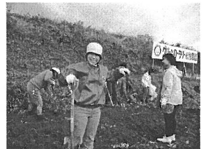
グリーンRC農園にて 「イモ掘り」 (2011. 11. 20)