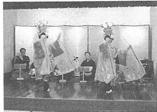
子供舞踊団「ザ・わらべ」による山鹿灯籠踊りとても優雅で上手でびっくりしました。