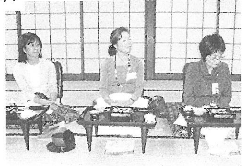
奥様方も参加して下さいました