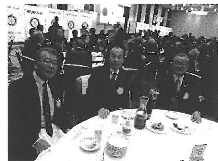
グリーンRC参加者席