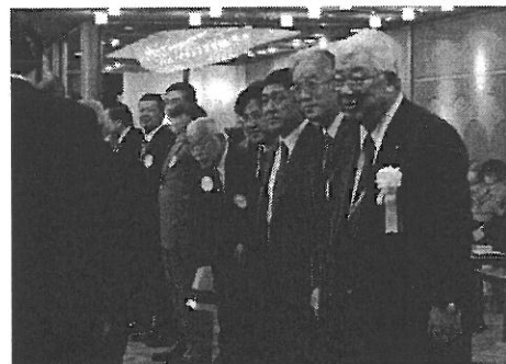
市域17RC 会長幹事でお でお出迎え