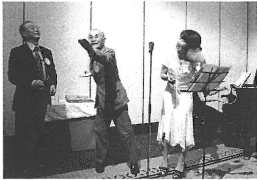
「揚げば尊し」を宮崎会員と 仙波会員が振り付きで熱唱！