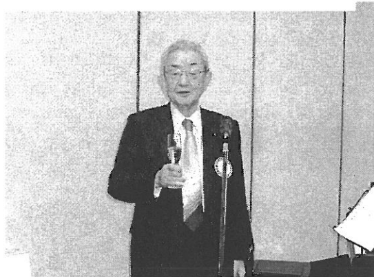
乾杯の音頭 十時パスト会長