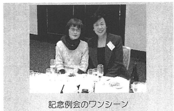
記念例会のワンシーン