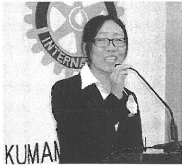
国籍:中国 熊本県立大学生所属

八代北RCがスポンサークラブロータリーの米山奨学生となって、月2回、八代北RCの例会に参加させて頂いてます。例会に出席するのは、普段聞けない様な興味深い卓話が聞けたり、企業を経営されているロータリアンの皆様とお話出来る事が、大変勉強になり嬉しいです。又、今現在、熊本グリーンRACに所属しており、グリーンのアクトメンバーと共にアクト活動も頑張ってます。そこでも大変楽しく友達も出来、勉強になってます。今後共よろしく願い致します。