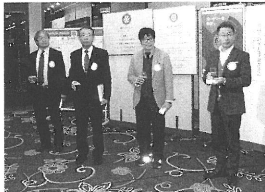
1月お誕生日の皆様(^o^)