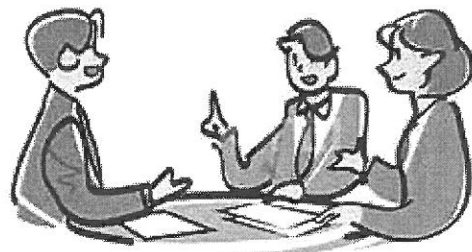
Illustration by 2768767