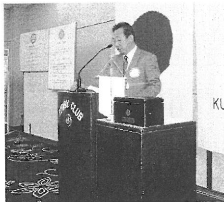
地区研修・協議会の様子