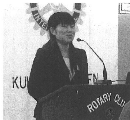
カ久夏実アクト会長挨拶

「熊本グリーンRAC今年度活動計画について」 —今年度活動方針と2ヶ月の活動報告—