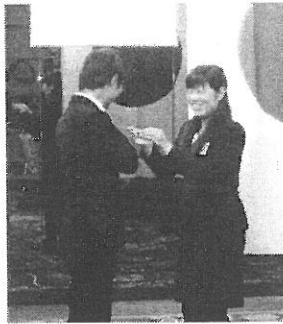
アクト入会式の様子。会長より アクトバッジが贈られました