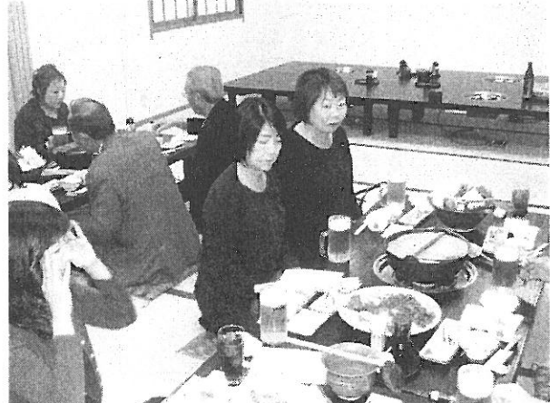
美味いつみれちゃんこ鍋と馬刺しを前に