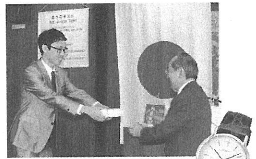
ぜひ世話クラブの例会で贈呈を!

(FAX : 03-3578-8281/メール : scholars@rotary-yoneyama.or.jp )