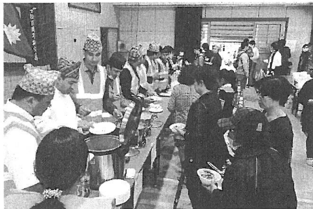
—第2720地区 大分市内8ロータリークラブ合同 ロータリーデー