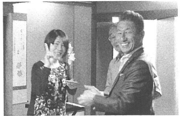
入選おめでとうございます