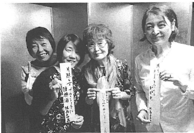
俳句・短歌・肥後狂句大会 入賞者