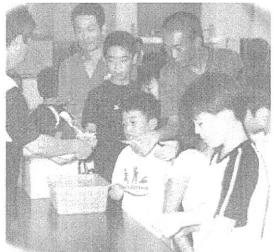
表品を貰えなかった方には 蜂楽饅頭6コ券を贈呈