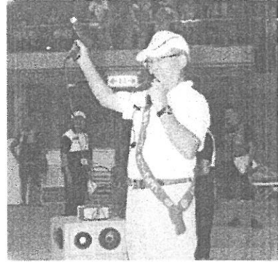
仙波会員がスターター!