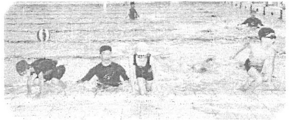
スイミングから開始!