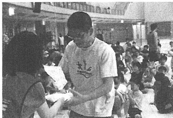
熊本グリーンRCより 蜂楽饅頭6こ券を参加賞として贈呈