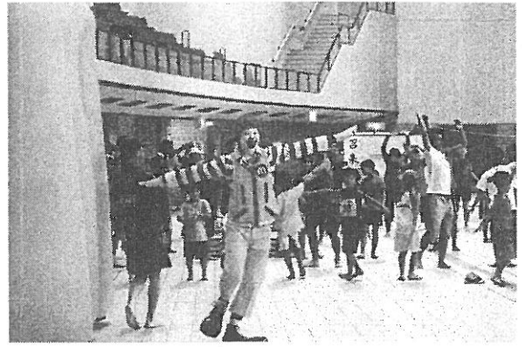
ドナルド君と準備体操