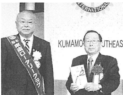
全員スマイルを 熊本県ロータリー奨学会へ贈呈