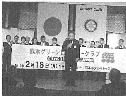
熊本グリーンRC創立30周年