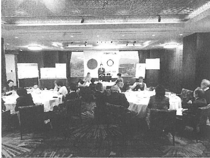
ホタル観賞会に参加の御家族と一緒に賑やかな例会