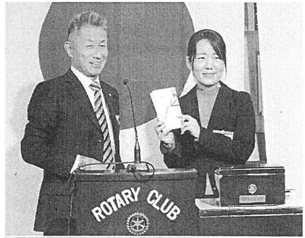
クリスマスに絵本を贈る会へ 支援金10万円を寄贈

・2018年12月 163,000円 県内社会福祉児童養護施設3施設、藤崎台童園に1人1冊ずつ55冊、菊水学園に1人1冊ずつ61冊、乳児院に1人1冊ずつ8冊:合計124冊