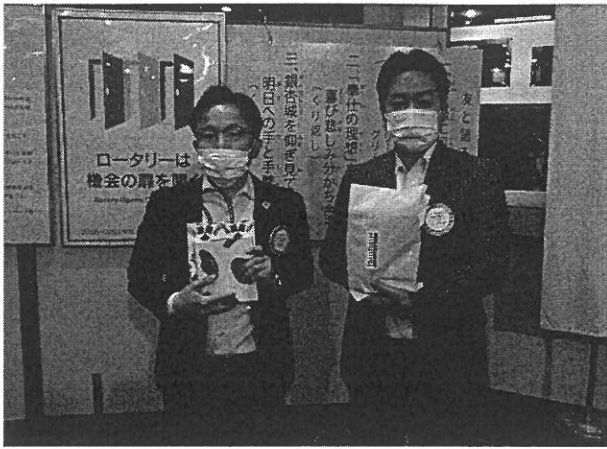
Happy Birthday, dear fellows!