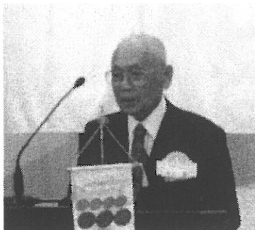
「ロータリーの先輩達」