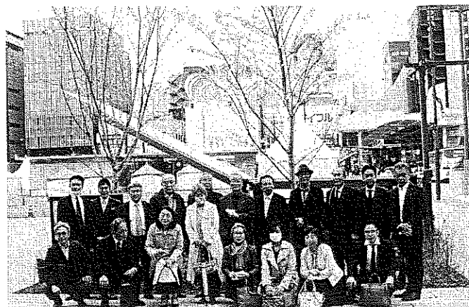
記念植樹の2本の桜の木の前で 集合写真撮影 (辛島公園)