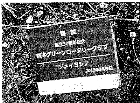
創立30周年記念でソメイヨシノをサクラマチに寄贈