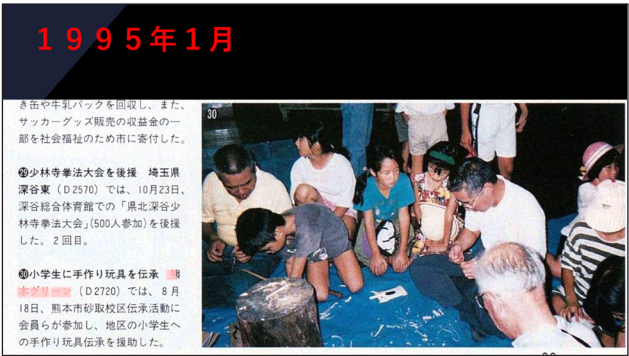
【砂取校区伝承遊び】