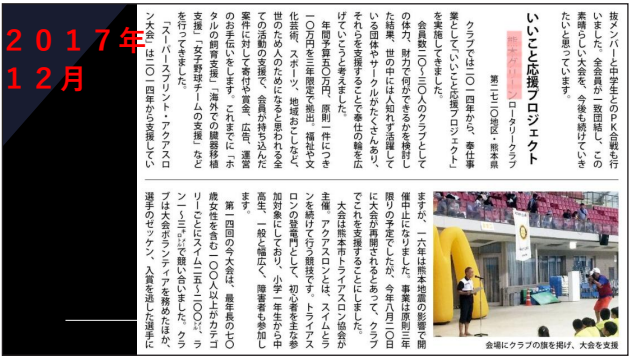
「いいこと応援プロジェクト」として スーパープリント・アクアスロン大会の支援

記録(歴史)を残そう 奉仕事業等の活動をした時は写真を多く撮りましょう ロータリーの友は、後世への記録になります。