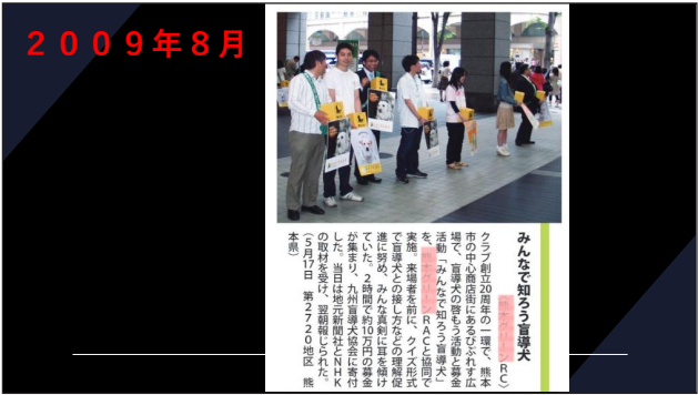
盲導犬理解推進キャンペーン