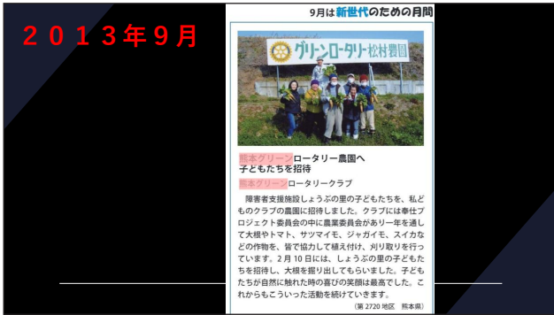
奉仕プロジェクト委員会の中の 農業委員会による、収穫作業